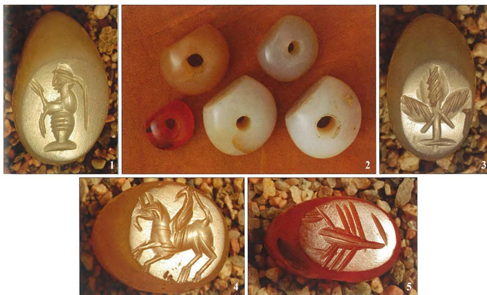
Сурет 2. Қоңыртөбе, № 65 жерлеу орнынан табылған гемма: Байпаков К.М., Смагулов Е.А., Ержигитова А.А., 2005, с. 187, фото 1.25.

1.2 Көтерілген қанаттар және олардың арасында қошқардың басы бейнеленген. Марданкүйік қаласының маңынан (Қоңыртөбе) кездейсоқ табылған. Өлшемдері: 21×27×23,5 мм; 20×18,5 мм; 5 мм. Сарғыш реңкті жартылай мөлдір халцедоннан жасалған. Ә.Х. Марғұлан атындағы Археология институтында сақтаулы (сурет 1.5).