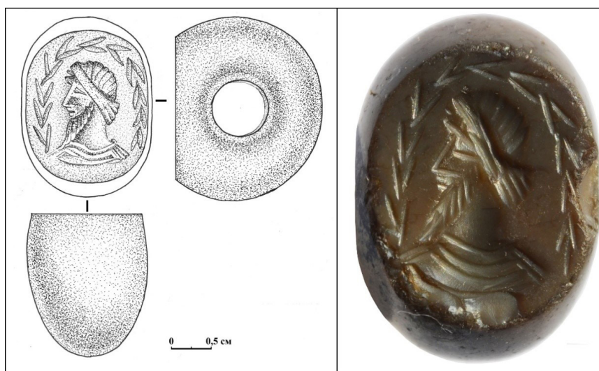
Сурет 5. Құмкенттен табылған оймышты халцедон мөр/гемма.

Құмкент қаласынан табылған мөр өңір үшін дәстүрлі болып табылатын халцедоннан жасалынған және кейінгі антикалық кезеңге жатады, пішіні кесілген жұмыртқа тәрізді («жалған жүзік»), бойлық тесігі бар (ені: 20 мм, диаметрі: 23 мм, биіктігі: 18 мм, бетінің өлшемдері 18×14 мм және тесігінің диаметрі: 6,45 мм). «Жалған жүзіктің» тегіс келген беткі жағы айна тәрізді жылтыратылып, ер адамның кеудесінен жоғары бейнесі бедерленіп түсірілген. Адамның басы қырынан, оң жағынан бейнеленген. Басы (шамасы) жұқа маталы таңғышпен оралған (шашы байқалады); басының ортасы кең баумен байланған. Мұндай таңғыштарды Аршакидтер әулетінің көптеген өкілдерінің суреттерінен табуға болады, олар «қуатты Парфияның негізін қалаушы» Митридат I-ден басталады (Дивбойз, 2008:41, рис. 7). Ер адамның ұзын, ұшы сүйір, мұқият таралған сақалы бар, мұрны кеңсірігіне дейін түзу. Киімнің бүктелмелері жартылай шеңбер сызықтармен көрсетілген – кеудеге, мойынның астына бүктелген. Бастың айналасында нұр немесе жарқылға еліктейтін, жапырақтардың кішкентай қатарларынан құралған жартылай шеңберлі бұтақ, бетінің шетінде бір иықтан екінші иыққа, әйгілі кейіпкердің басын айнала ойылған. Бұл мөрдің шетінде (иықтан жоғары) – сол жағынан оң жағына қарай доғаланып, қиғаш сызықша-жапырақтары бар өсімдікке ұқсас (бұтақты) етіліп кеткен. Бедер көлемді ойылып оймышталып орындалған. (сурет 5).