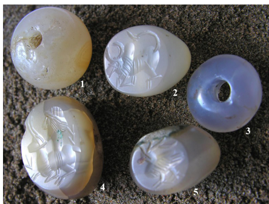
Сурет 4. Сидак қаласындағы гибадат кешеніндегі көмбеден шыққан гемма: Смағұлов Е.А., 2013, с. 118.

Олай болса, барлық 11 гемма табылған жері (жағдайлары) бойынша 3 топқа жиналады.