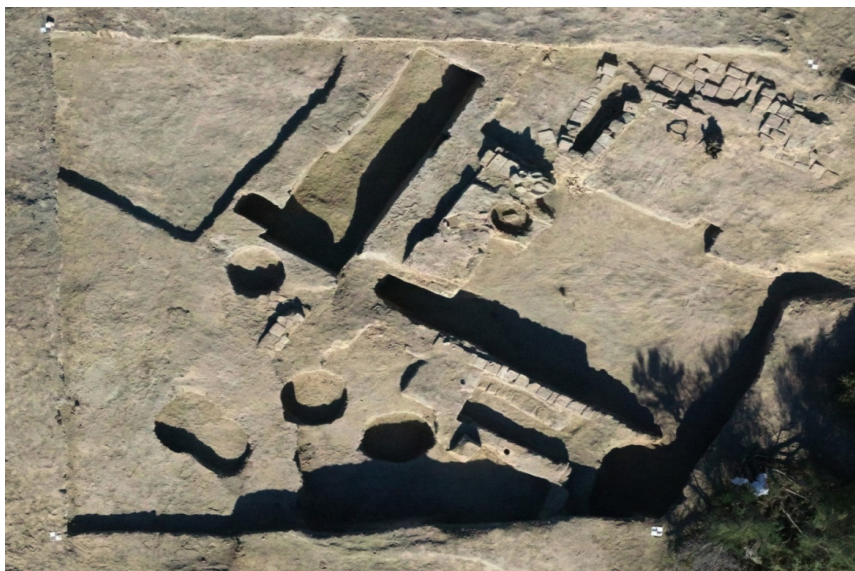
2-сурет Қазба алаңында ашылған екінші құрылыс кезеңінің әуеден көрінісі

Екінші құрылыс кезеңі. Қазба жұмыстарын әрі қарай жалғастыру барысында 0,7 м тереңдіктен екінші құрылыс кезеңінің екі бөлмесі анықталды. Бірінші бөлме қазба алаңының орталық бөлігінде, яғни бірінші құрылыс кезеңінде орналасқан асхана бөлмесінің астында орналасқан (2-сурет).