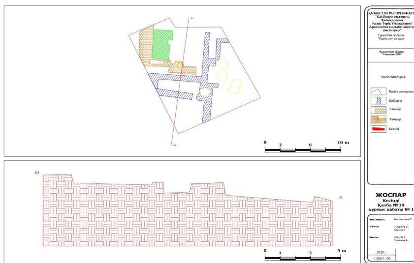
2-сызба Қазба №18. 1,2 құрылыс кезеңдерінің тік кесіндісі

Бөлме 1. Бөлменің шығыс қабырғасы ғана ашылды. Оңтүстік-батыстан солтүстік-шығысқа қарай созылып жатқан қабырғаның ұзындығы 4 м, сақталған биіктігі 0,7 м, қалыңдығы 0,8 м. Қабырға көлемдері 20x20x40 см болып келетін қам кесектен қаланған. Осы қабырғаның үстінде 0,1 м қалыңдықта әк аралас топырақ төселген. Оның үстіне бірінші құрылыс кезеңінің бір қатар күйдірілген қыштан қаланған қабырғасы орналасқан. Осы көлемдегі қам кесектер қаланың шығыс қақпасындағы қорған қабырғаларында қаланған (Жолдасбаев және т.б. 2012: 185). Ал оңтүстік қабырғасы бірінші құрылыс кезеңіндегі тандыр құрылысының астында қалғандықтан ашылмады. Ал, батыс қабырғасы жоғарғы құрылыс кезеңіндегі жерлеу орнымен байланысып жатқан болуы мүмкін. Бөлменің солтүстік қабырғасы қазба жиегінің астында қалғандықтан толық ашылған жоқ.