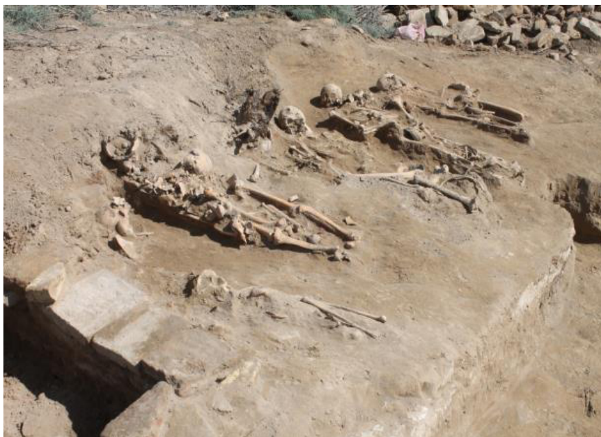
1-сурет Қазба алаңындағы жерлеу орны

№6 қоқыс шұңқыры қазба алаңының оңтүстік-батыс бөлігінде, № 5 қоқыс шұңқырының солтүстігінде 1 м тереңдікте орналасқан. Ашылған қоқыс шұңқырының іші күл аралас бос топырақтан табанына дейін тазартылды. Сонымен қатар ішінен ыдыс сынықтары мен ұсақ мал сүйектері шықты. Оның аумағы 1,2 м, тереңдігі 0,4 м.