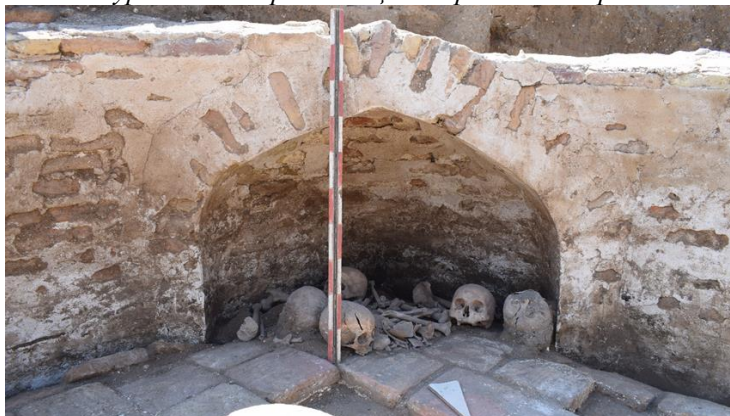
4-сурет-№3 көрханадағы жерленген сүйектер