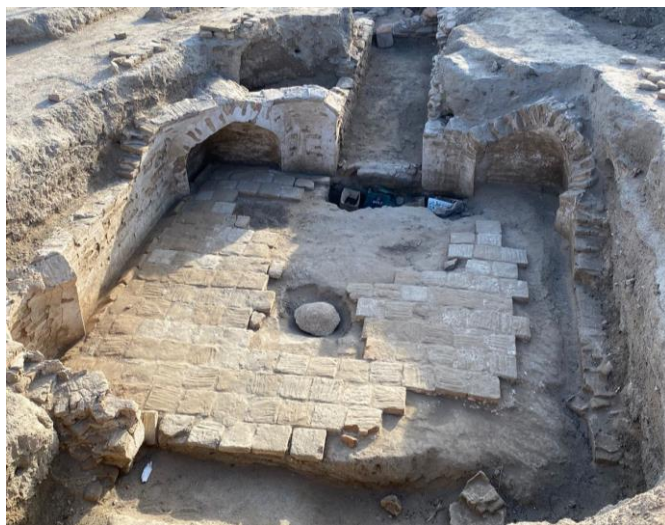
3-сурет - №3 көрхананың солтүстіктен көрінісі

2021 жылғы қазба 2 көрхана орнын толық ашып, «Хандар зиратындағы» 1999, 2006 жылғы зерттеу нәтижелерін толықтыра түсті. Бір ерекшелігі, көрхананы қоршаған кесене ізі әзірше табылмады. Көрхана көлемі, қаланған материалдар - кірпіштер, ішкі жағының сылануы, еденге кірпіш төселуі оларды қайталайды. Тіпті №3 көрхана атауына ие болған нысанда ағаш табыттың қалдықтары да шықты (3-4-сурет).