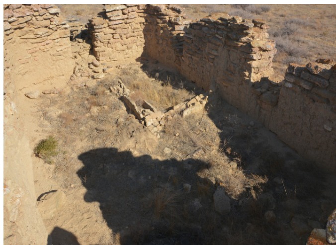
Сурет 6. Изенағаш мешітінің солтүстік-шығыс бұрышындағы әйелдерге арналған шағын бөлме. Суретті түсірген С.Е. Әжіғали, 2019 ж.