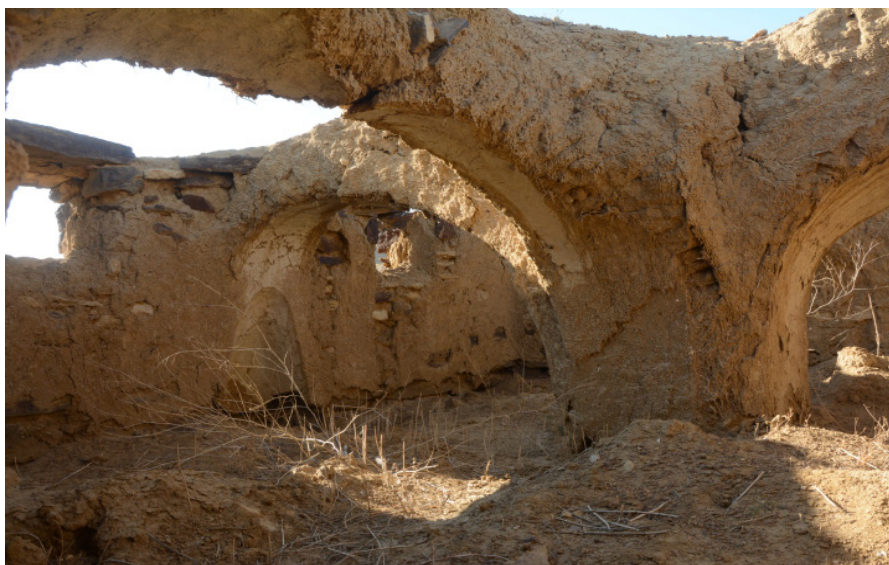
Сурет 2. Беспай мешітінің намаз оқитын бөлмесінің ішкі көрінісі. Суретті түсірген С.Е. Әжіғали, 2019 ж.