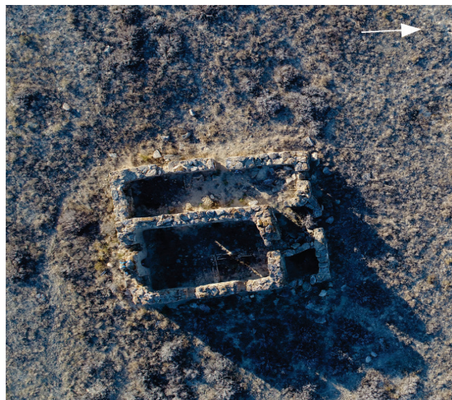
Сурет 4. Изенагаш діни-тұрғын кешеніндегі мешіт. Жоғарыдан түсірілген көрінісі, 2019 ж.