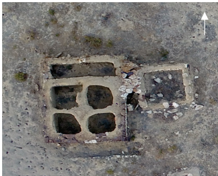
Сурет 1. Беспай діни-тұрғын кешеніндегі мешіт. Жоғарыдан түсірілген көрінісі, 2019 жыл.

Turganbaeva L.R. K problem izuchenie kul'tovo-zhilishhnuh kompleksov Zapadnogo Kazahstana (On the problem of studying the cult and housing complexes of Western Kazakhstan) // Materialy 1-go i 2-go Simpoziuma po kazahskomu pamjatnikovedeniju. Almaty-Atyrau, 2012. S. 150-156. [In Russian].