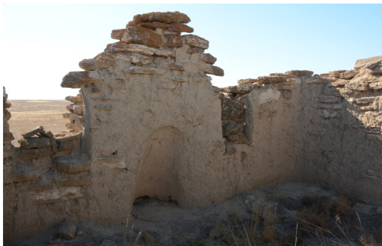
Сурет 5. Изенағаш мешітінің намаз оқитын бөлмесінің оңтүстік қабырғасындағы михрабы. Суретті түсірген С.Е. Әжіғали, 2019 ж.