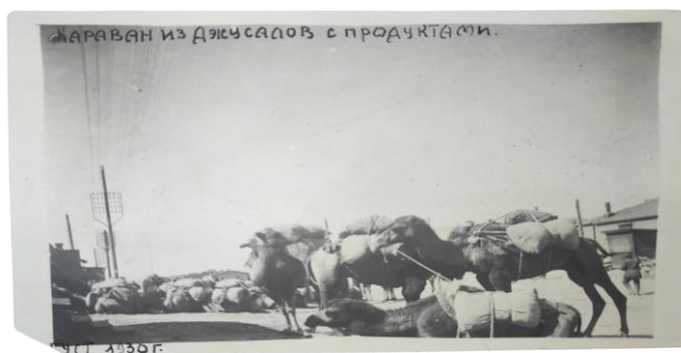
Рис.3. ФПК 12732/4 «Караван верблюдов с продуктами, прибывший из Джусалов в Карсакпай». [Fig.2. FPC 12734 Photograph by an English photographer "Transportation of sleepers on camels during the construction of the narrow-gauge railway Dzhusaly-Karsakpai"]