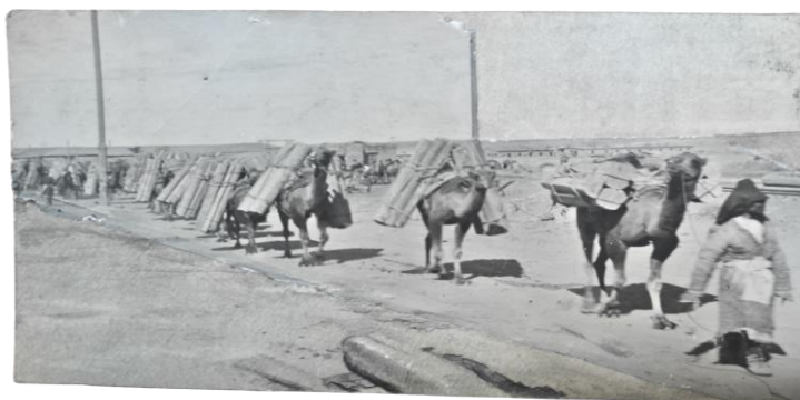
Рис.2. ФПК 12734 Фото английского фотографа «Перевозка шпал на верблюдах на строительстве узко-колейной железной дороги Джусалы-Карсакапай».