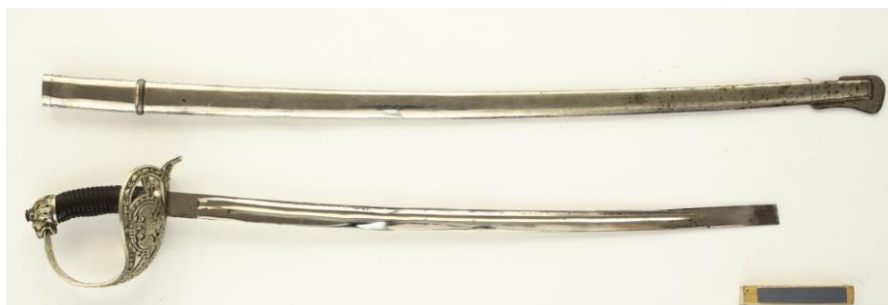
Рис.1 Трофейная шпага немецкого генерала.

Справедливости ради надо отметить, что музейные сотрудники несмотря на все трудности вместе со всеми боролись за сохранение культурного достояния нашего народа и предпринимали все меры для пополнения музейного фонда. Так, в 1942 году музейный фонд пополнился трофейной шпагой истребленного германского генерала, который в музей был сдан Бауыржаном Момышулы вместе с бойцами, командирами и комиссарами и политработниками 1073-го Гвардейского Стрелкового Талгарского полка, 8-й гвардейской ордена «Красного Знамени» стрелковой дивизии имени генерал-майора Панфилова. Экспонат был принят в фонд под номером КП 4575 (рисунок-1) и в книге описи обозначен как «Шпага немецкого-генерала, ножны металлические. Передан 8 гвард.дивизией». Об этом свидетельствуют и письма, сохранившиеся в Центральном архиве Казахстана, где можно ознакомиться с данной информацией более подробно (ЦГА РК. Ф.1308. Оп.1. Д.306. Св.21. Л.29-30) и (ЦГА РК. Ф.1308. Оп.1. Д.332. Св.21. Л.19).