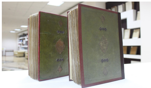
Сурет 1. Ибн Халликан. Уафийятул а'ийянва-анба' абна' аз-заман» («Белгілі тұлғалардың некрологтары мен олардың замандастары туралы хабарлар») еңбегінің екі томы

Талқылау. Нұр-Сұлтан қаласындағы Қолжазбалар және сирек кітаптар ұлттық орталығының қорында ежелгі дәуірден қазіргі күнге дейінгі Отандық және әлемдік тарихтың терең сырына үңілуге мүмкіндік беретін бірнеше сирек мұралар қатары бар.