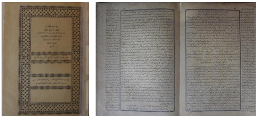
Суреттер 6-7. Ибн Халликан кітабының II томы (Халликан II том, 1892)

Ал, кітаптың екінші томының парақ саны – 424. Сирек мұраның алғашқы төрт бетінде 369 ортағасыр ойшылдар есімдерінің тізімі алфавиттік реттілікпен берілген. Ортағасырлық ғұлама-ойшылдардың ішінде Селжұқ шахы Алб Арслан Селжуки (XI ғ.), Шығыстың дана ойшылы Әбу Нәсір әл-Фараби (IX-X ғғ.), энциклопедист-ғалым, дәрігер Әбу Бәкр Рази (IX-X ғғ.), Қасиетті Құран түсіндірмесін жасаушы, философ, филолог-ғалым Махмуд Замахраши (XI-XII ғғ.) және т.б. атап өтуімізге болады (Халликан II том, 1892).