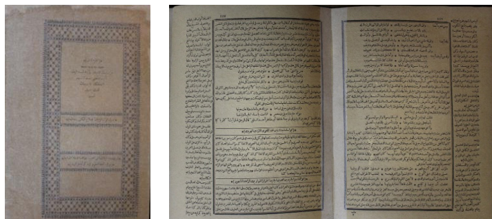
Суреттер 4-5. Ибн Халликан кітабының I томы (Халликан I том, 1892)

6 парағында ғұламалардың есімдері алфавиттік реттілікпен негізгі және қосымша болып берілген. Кітаптың екінші томында есімдер саны – 1133. Атап айтатын болсақ, Ханбали мазхабының негізін қалаушы Ахмад Ибн Ханбаль (VIII-IX ғ.ғ.), ортағасырлық белгілі сопы Ибрахим ибн Адхәм (VIII ғ.), ислам құқықтанушысы Әбу Бәкр Бәй Хақи (XI ғ.), тарихшы-ғалым, «Бағдад тарихы» атты кітабының авторы Хаги Бағдади, араб тілі, грамматика бойынша еңбектер жазған белгілі ғалым Сә'ләб Нахви (IX-X ғғ.) (Халликан I том, 1892).