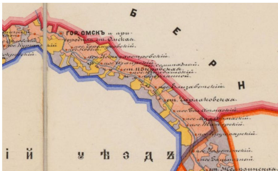
Рис. 3. Карта земель Сибирского казачьего войска 1900-х гг. Омский уезд (Карта войсковой территории. 1900. 2–3 л.) [Fig. 3. Map of the lands of the Siberian Cossack army of the 1900s. Omsk county (Map of the military territory. 1900. 2–3 s.)]

Тем не менее, если обратить внимание на участки десятиверстной полосы в районе Омского уезда (рис. 3), станет видно, что офицерские участки расположены именно на левобережной, более богатой лугами части Иртыша, при минимальном наличии юртовых наделов.