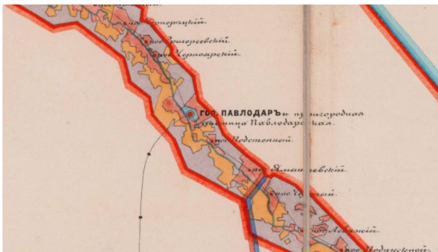
Рис. 2. Карта земель Сибирского казачьего войска 1900-х гг. Павлодарский уезд (фрагмент) (Карта войсковой территории. 1900. 2-3 л.) [Fig. 2. Map of the lands of the Siberian Cossack army of the 1900s. Pavlodar county (Map of the military territory. 1900. 2-3 s.)]

На данном фрагменте карты видно, что большинство участков десятиверстной полосы принадлежало офицерам (они выделены желтым цветом), меньше – рядовым казакам (юртовые наделы выделены розовым), фиолетовый – это запасные войсковые земли.