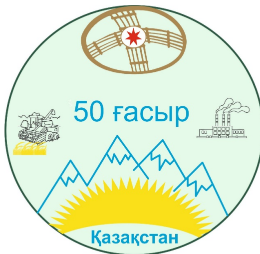
3-сурет. Елтаңбаның жобасы [Fig.1. The project of the state Emblem].

Мақаламыздың соңында бүгінгі заман түркі халықтарының оқырман қауымының алдында этномәдени мәртебесі жоғары тарихи жайға байланысты бір ұсынысты айтқанды жөн көріп отырмыз. Ол бүкіл түркі халықтарының ата-бабаларынан сақталып қалған Еуразия масштабында дара түркітілді сақ тайпасының дара қабірінің үстіне 2010 ж. Мәңгілік Ел аркасы салынған болатын. Негізінде, мұндай ескерткіш тек бір ғана Қазақ Елінің Астана қаласында бар. Бұл күнде Мәңгілік Ел аркасының астында жатқан қабірдің ж.с.д. VII-VI ғасырларына, түрік тайпыларына жататынын ескере отырып айтатын болсақ, түркі халықтарының тізе бүгіп, бас иетін киелі ата-бабаларының қабірлерінің бірі ретінде әлемге келешекте танымал болса екен деген үміттеміз. Бүгінгі түркі қауымына жасап отырған бұл ұсыныс оңға басса, түркі әлемінің рухы мен бірлігі әрқашан жоғары болары хақ!