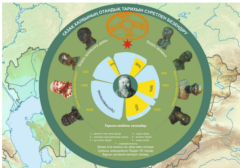
1-сурет. Қазақстанды Қара шаңыраққа сәйкестендіріп суреттеу нұсқасы [Fig. 1. A version of describing Kazakhstan in accordance with Kara Shanaryak]

Ал соңғы екі мың жыл бойы біртіндеп көне қазақ жеріне шығыстан тайпалар кірмелік жасаған (ашық сары бояу). Оны жергілікті тұрғындардың бейне жүзінен көре аламыз. Осыншама уақыт бойы араласу салдарынан бүгінгі қазақтардың бейнесінде, дене құрылысында моңғолоид компонентінің 70 % пайда болды. Ал қалған 30 % көне ата-бабаларынан тікелей сақталып қалған ерекшеліктер деп санаймыз. Бұл жайды біздер 30 жыл бойы бүгінгі ауылдық жерде тұрып жатқан қазақтар арасында бір мезгілде, бір топ өкілдерін антропология ғылымының 6 бірдей саласы бойынша - соматологиясын, тіс морфологиясын, қан жүйелерін, дерматоглификасын, дәм сезімін, бас сүйек морфологиясын зерттеу арқылы дәлелдедік.