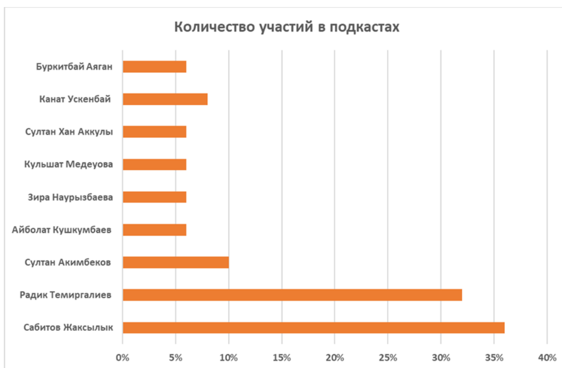
Диаграмма 3. Наиболее популярные участники исторических подкастов [Diagram 3. Most Popular Historical Podcast Contributors]

Высокий интерес к личности Д. Кунаева объясняется его лидерскими и политическими качествами, которые он проявлял на посту руководителя Казахстана. Время его правления в целом оставило положительные воспоминания у значительной части населения, что способствует постоянному интересу к его фигуре среди казахстанцев.