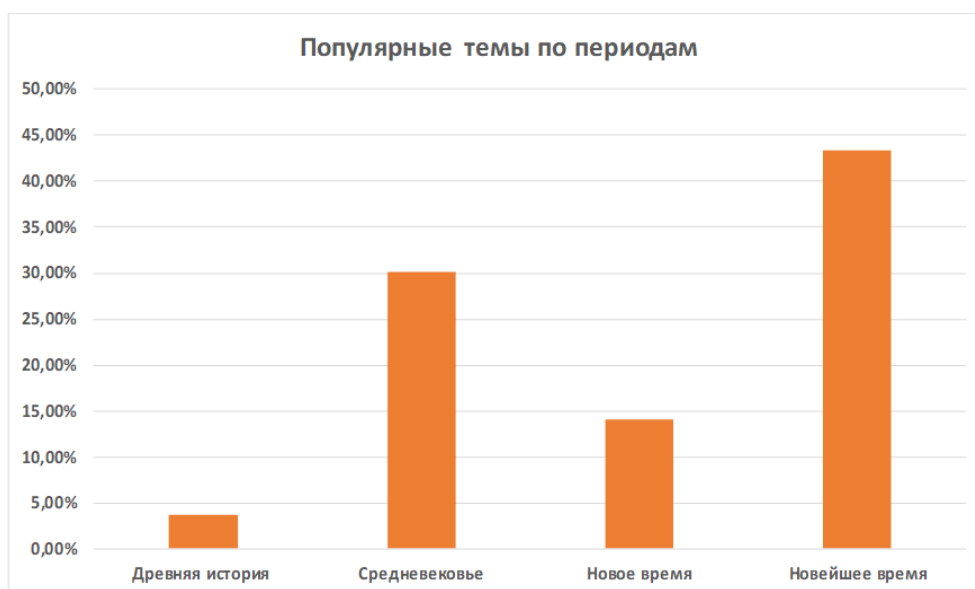
Диаграмма 1. Классификация подкастов по периодам истории Казахстана [Diagram 1. Classification of podcasts by periods of Kazakhstan history]

Как видно из представленных данных, подкасты, ориентированные на рассмотрение древней истории Казахстана, занимают лишь – 3,7%. Они хотя и представляют сравнительно небольшую долю, но имеют свою значимость, которая определяется растущим интересом к этногенезу, историческим и культурным артефактам, дающим представление об уровне развития культуры региона. Значительная доля подкастов посвящена средневековой истории Казахстана, она составляет – 30,1%. Такой процент подкастов отражает интерес аудитории к истории последней степной империи Евразии, к истории формирования Улуса Джучи и Казахского ханства. Подкасты, ориентированные на период Нового времени, хоть и занимают меньшую долю – 14,1%, все же обеспечивают баланс в хронологическом охвате. Этот период включает в себя болезненные трансформационные процессы, связанные с казахско-джунгарскими войнами, потерей независимости, колонизацией, окончательным крушением традиционного хозяйственно-культурного типа – мобильного скотоводства, а также коллективной и исторической памяти об этих процессах. Наибольший интерес среди подкастов вызывает тематика Новейшего времени – 43,3%, что свидетельствует о сфокусированности на проблематику современной истории страны.