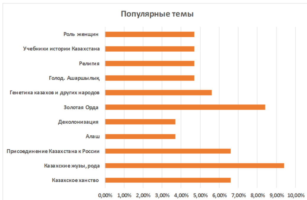
Диаграмма 2. Наиболее популярные темы в подкастах по истории Казахстана [Diagram 2. Most Popular Topics in Kazakhstan History Podcasts]

Согласно графику (Диаграмма 2), наиболее популярными среди аудитории являются две темы: «Казахские жузы, рода» и «Золотая Орда». Первая тема имеет наибольший показатель – 9,4% и рассматривается нередко в контексте общих тем, посвященных отечественной истории в целом, а также этнографии и родоплеменным структурам казахов. Это сближает ее с темой «Генетика казахов и других народов» (5,6%), в рамках которой обсуждаются исследования, связанные с традиционной генеалогией – шежире .